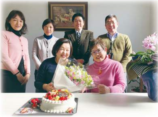
今年1月 後期高齢者の仲間入り