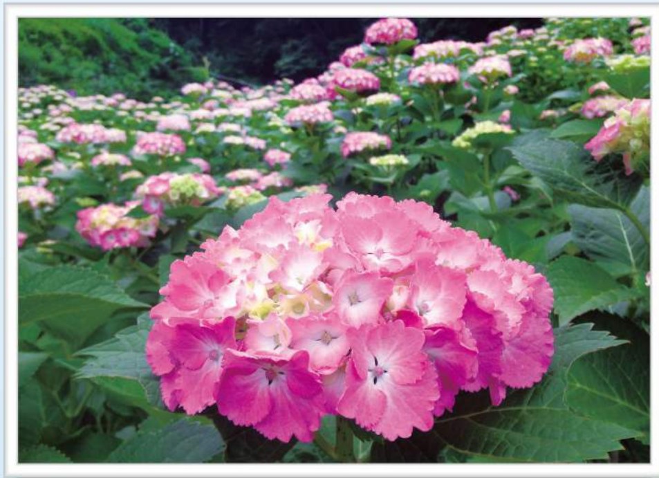
形原温泉 あじさいの里