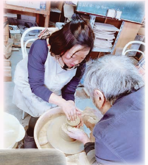
ろくろ初体験で奮闘

今年、春の桜開花も早く、制服姿を桜が咲いているうちにと記念撮影を先撮りする家族が多かったです。紫陽花も早咲きで季節の移り変わりが少しずつずれてきているのでしょうか。最近では梅雨入り宣言が各地でされていますが、「入梅」とい言葉があります。梅雨の季節に入る最初の日を指し、梅の実が熟する頃に雨季に入ることから入梅といわれるようになったとか。先日、「雨が多くなるから梅雨は本当に嫌だ」と言うと、「でも雨が上がった次の日の紫陽花はとても元気で、綺麗だよ」と友人に言われました。なんて、ゆとりあるしなやかな心…。しかも私が紫陽花好きであることを知っている表現です。 その日から雨上がりの紫陽花をより楽しく観ることができ、私の幸せ感が1%アップしました。