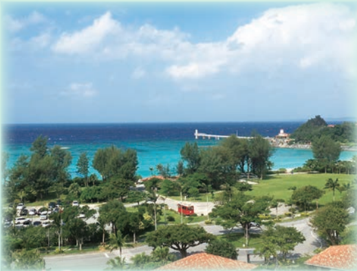
「沖縄研修会にて」 この海を見るとスーッと心が軽くなり、幸せを感じます。