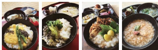
～あさの坐禅会～季節のお粥

少し敷居が高く思われがちな仏教を、日常で活かしてもらいたい！と「あなたのそばにある禅」とし、私がお寺へ嫁いで感じたことなどを綴った「寺嫁だより」や、入社前に坐禅体験「あさの坐禅会」、本堂でキャンドルに灯されながらの「キャンドル瞑想ヨガ」や、まいにちが特別になる「おてら短歌クラブ」など定期開催しています。興味のある方は、ぜひご一報くださいね。みなさんとのご縁を楽しみにしています。