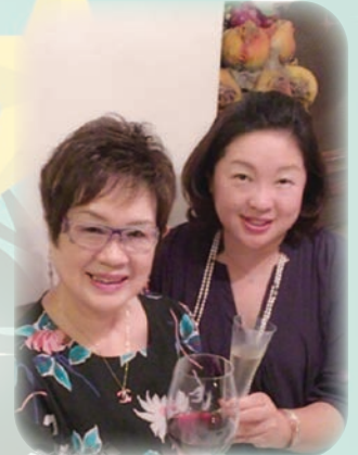
会長と久しぶりの食事会

今年も、あと数日で終わり、新しい年の到来です。この一年はどのような幸せを感じることができたのかと振り返ります。それはある難病と闘いながら、それでも小さなことに幸せを感じ「生きていく決意をしました。」という一人の女性の言葉が心に残ります。正直、「生きていく決意」をした経験はなく、生きていくことに感謝と言いつつ当たり前のよう日々、過ごしているような気がしません。彼女は難病にかかり、挫折し苦しみ、それでも「生きていく決意」をして夢を諦めずに生きていくフルト奏者です。「幸せのアンテナを上げ、幸せのハードルを下げる」。目に入る景色や香り、人からのちよつとした気遣いや振る舞いなど、ほんの小さなことにも幸せを感じられるように、「なんだか幸せ」の感度を上げる。それは、落ち込んだ時の心も早く回復することができることを伝えてくれました。