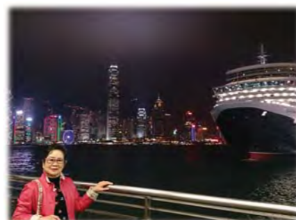
念願のクイーンエリザバス号 香港にて