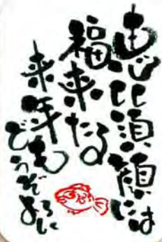
ゆうき澄江氏の下、 つてふで 伝筆を修業中