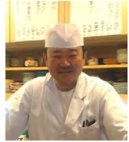
料理に負けず、歌も上手い若大将

昨年にご縁あって、時々お店を訪れます。お寿司はもちろんのこと、若大将の創る品の良い和洋さまざまな料理が、お客様を飽きさせません。一宮市では古くからあり、御存知の方も多いと思いますが一度、足を運んでいただければ幸いです。会合などでのお弁当も好評です。